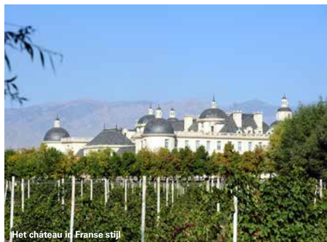
Het château in Franse stijl